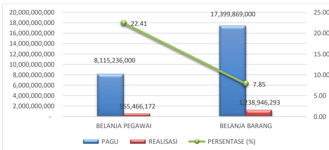
Grafik 3 Realisasi Keuangan Berdasarkan Belanja